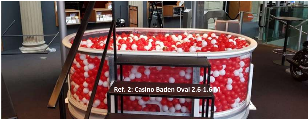
Ref. 2: Casino Baden Oval 2.6-1.6 M

ohne Stoppuhr Optimale Grundfläche 3x3 Meter